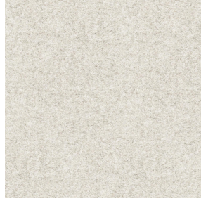
ELAINA Ivoire 115 Druck design