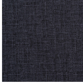
MURA NOIR 10 Druck design