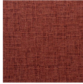
MURA GRENAT 56