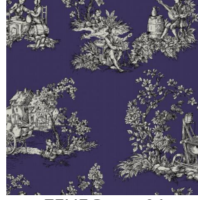
ZELIE Prune 84