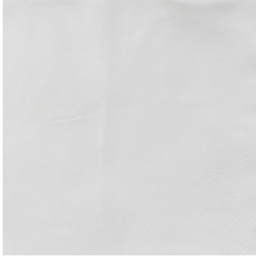
TAO BPI 00 Druck-Trägergewebe