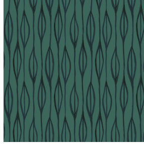
YENDI Sapin 126 Druck design