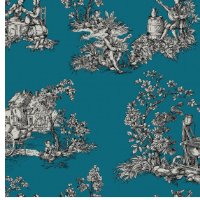
ZELIE Céladon 135 Druck design