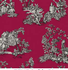
ZELIE Rubis 59