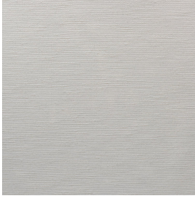
SOLLY BPI 00 Druck-Trägergewebe