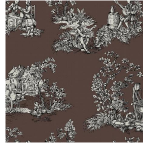
ZELIE Taupe 95