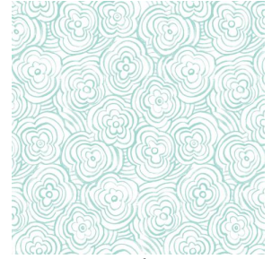
ONDES glacier 43