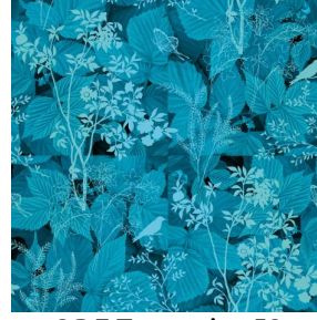
ODE Turquoise 53