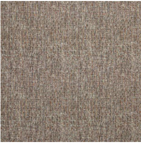
OSCAR Tomette 60