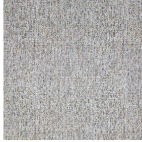
OSCAR Cordage 172 Druck design