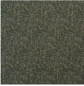
FUZ Bronze 13