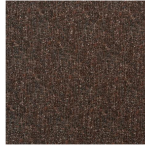
FUZ Acajou 150