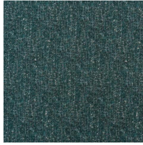
FUZ Sapin 126