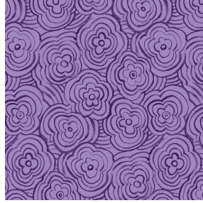
ONDES Violine 105 Druck design