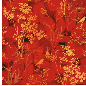
ODE Corail 14 Druck design