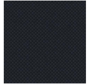
CHARLOTTE Noir 10