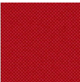
CHARLOTTE Fiesta 131