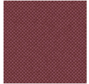
CHARLOTTE Chaudron 118