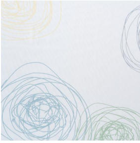
NAHIA TURQUOISE 53