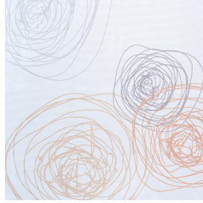
NAHIA CURRY 184 Druck design