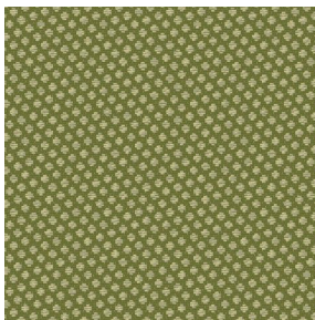
GONIDIE Mousse 92