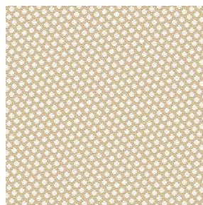
GONIDIE Crème 32