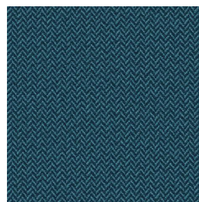
SCOURTIN Céladon 135