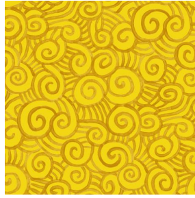
TUMULTE Mais 37