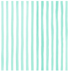
SONG Menthe 122