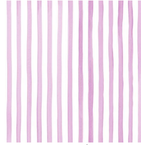
SONG Framboise 81