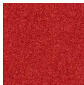
ELAINA Rouge 21