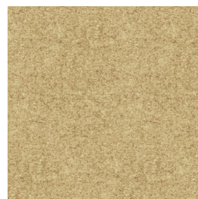
ELAINA Beige 63