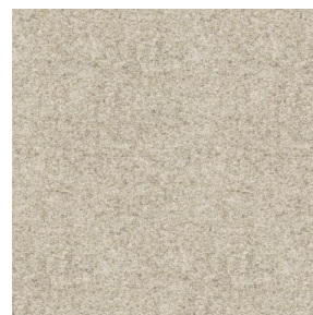
ELAINA Lin 11