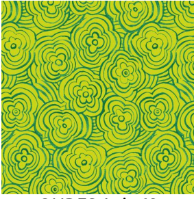
ONDES Anis 62