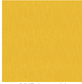
RIVE Jaune 46