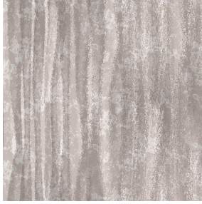
6027 Taupe 95 Druck design