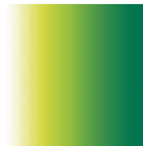
ZENITH Cactus 36