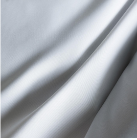
POL 00 Druck-Trägergewebe