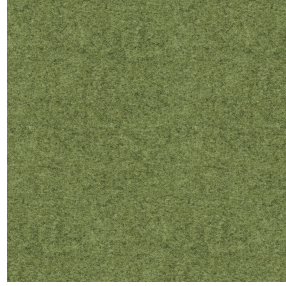
ELAINA Lierre 124 Druck design