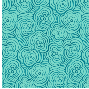
ONDES Turquoise 53 Druck design