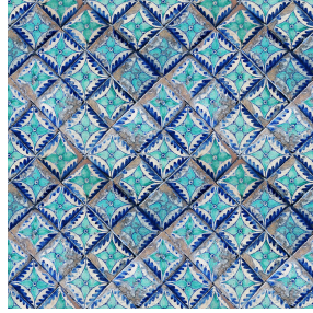
PIETRO Azur 137 Druck design