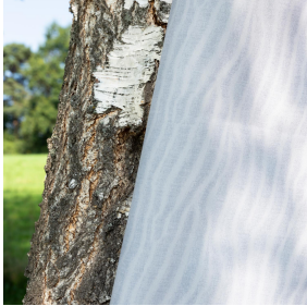
SABLE Lin 11 Druck design