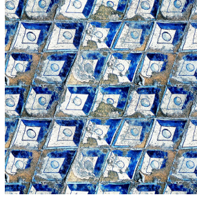
CLEMENTINA Azur 137 Druck design