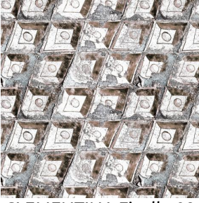
CLEMENTINA Ficelle 09