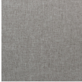
NORA Gris envers blanc 63 Druck-Trägergewebe