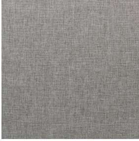
NORA Gris envers blanc 63 Druck-Trägergewebe