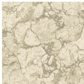
CARRARA Ficelle 09