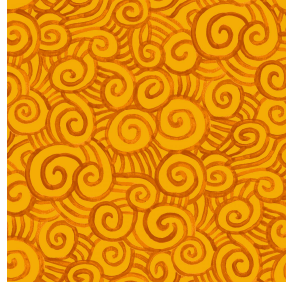
TUMULTE Safran 49 Druck design