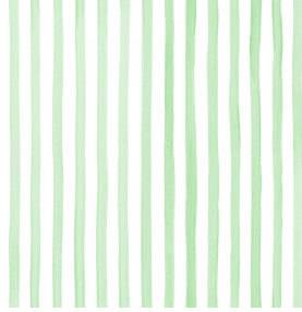
SONG Tilleul 103 Druck design