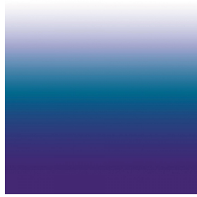
ZADIG Bleu 41 Druck design