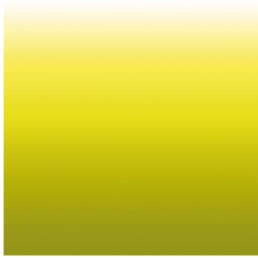
ZADIG Anis 62