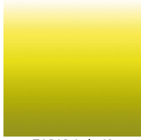
ZADIG Anis 62