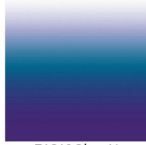
ZADIG Bleu 41