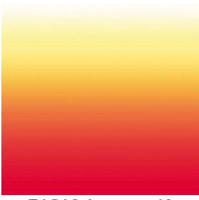
ZADIG Agrume 69