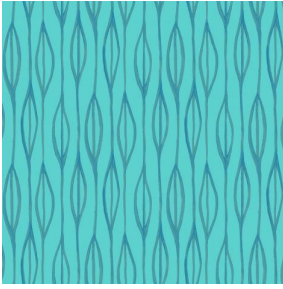
YENDI Lagon 110