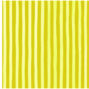
SONG Agrume 69 Druck design