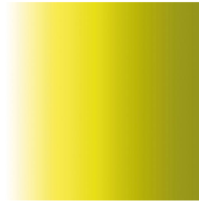
ZENITH Anis 62