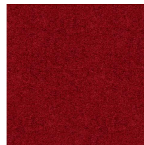
ELAINA Fiesta 131