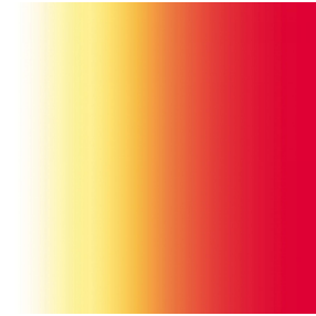
ZENITH Agrume 69 Druck design