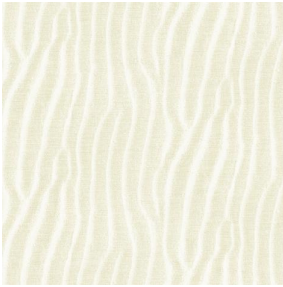
SABLE Ivoire 115