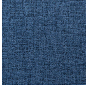
MURA SAPHIR 106 Druck design