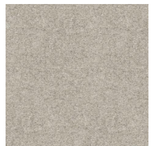
ELAINA Naturel 26