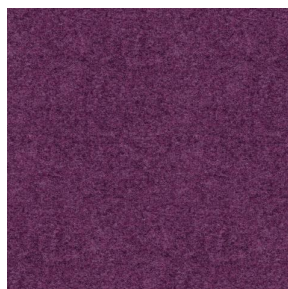
ELAINA Violine 105