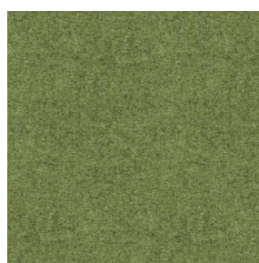
ELAINA Lierre 124