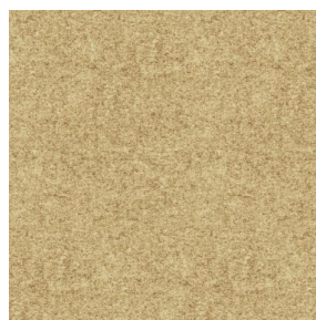
ELAINA Beige 63