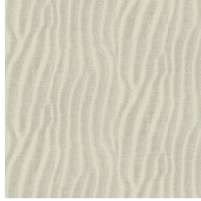
SABLE Lin 11 Druck design