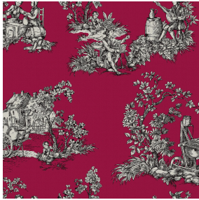
ZELIE Rubis 59 Druck design